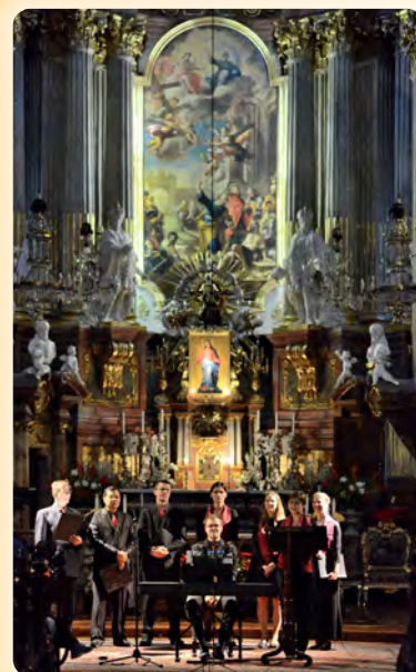
New Gospel Konzert in der Wiener Peterskirche

Donnerstag, 10. April 2014, 18:00 EMC 2 Live! Solution Center, Wien 12, Am Euro Platz 3, 3.Stock